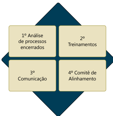
Figura 1 - Os quatro pilares de atuação do DAQ da SSCE. São Paulo - SP, Brasil, 2020

O mapeamento do processo de auditoria de qualidade evidenciou que para mitigar análises em não conformidade, na regulação do pagamento de contas, o DAQ da SSCE atua em quatro pilares, conforme mostra a Figura 1: